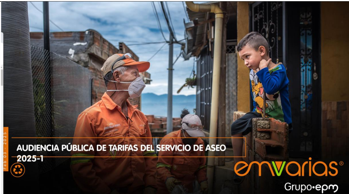
Imagen. Audiencia Pública 2025-1