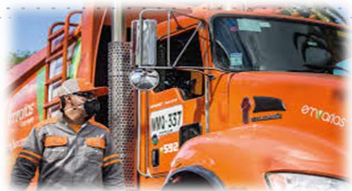
Puerta a Puerta