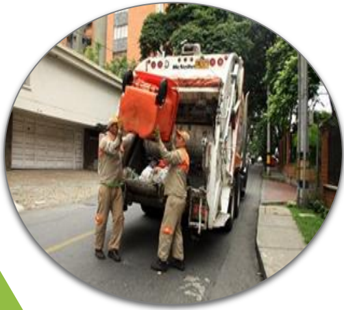
Recolección y Transporte