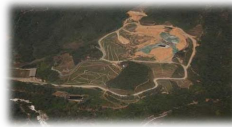
Hasta el Relleno Sanitario La Pradera

Frecuencia: Dos veces/semana- en el sector residencial y de 2 a 21 veces/ semana en sectores comercial e industrial y en el centro de la ciudad.