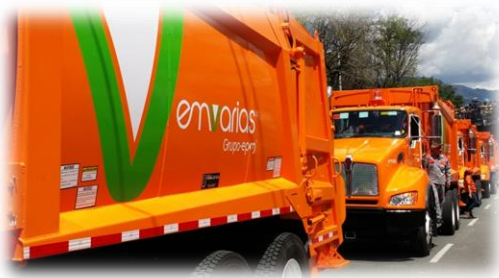
Transporte a 57Km